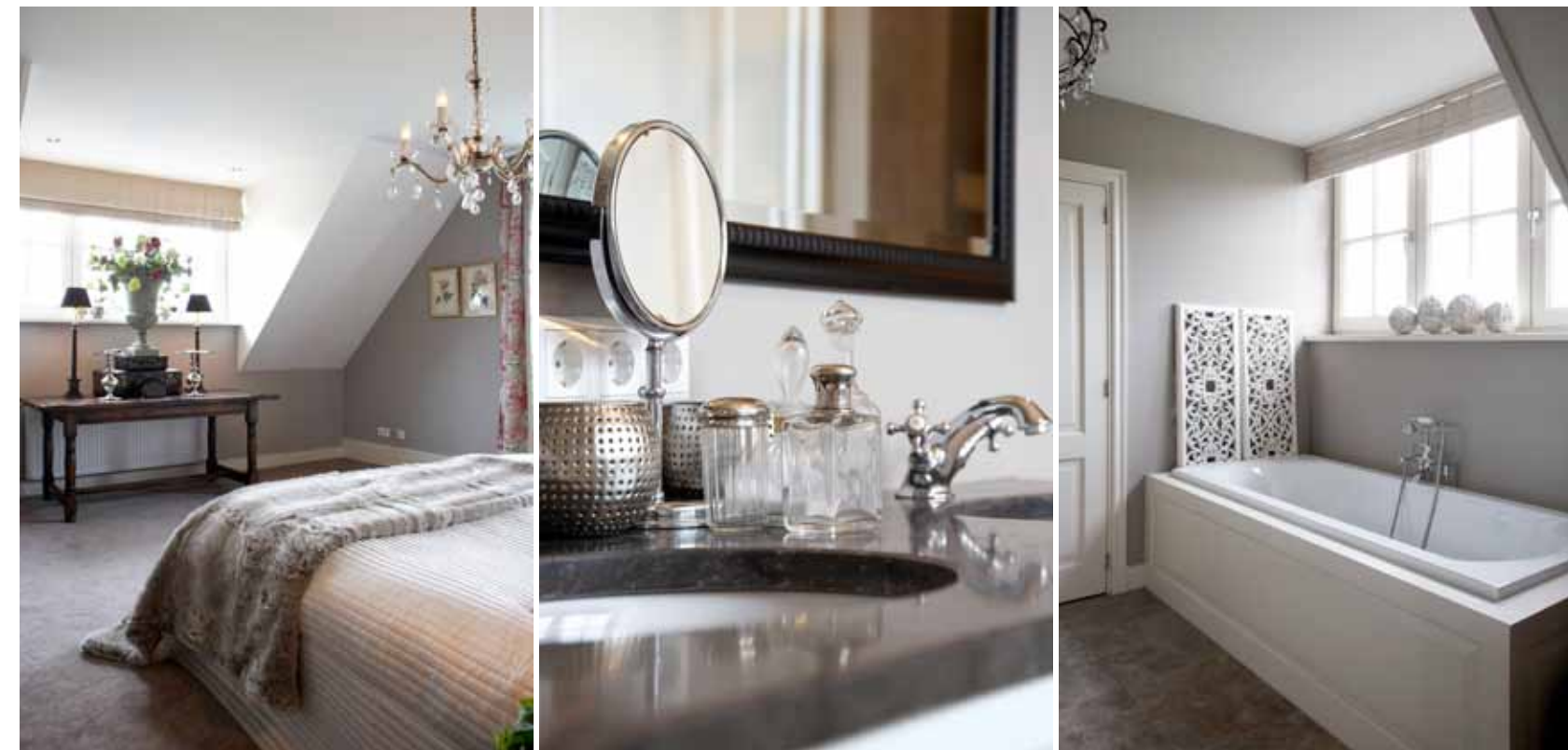
Foto rechts: aangrenzend aan de ouderslaapkamer ligt de badkamer. De gem leerde vloertegels die doorlopen in de wanden van de douche vormden de basis van waaruit de badkamer verder werd ingericht.

Wie vanuit de hal rechtsaf gaat, komt in een verlaagd woongedeelte met een grote multifunctionele ontspanningsruimte, inclusief knusse loogerhoek. Die grote ruimte ligt op de plaats van de voormalige schuur. Naast deze ruimte voert een trap – met daaronder een zee aan opbergruimte – omhoog naar twee grote slaapkamers op de eerste verdieping.