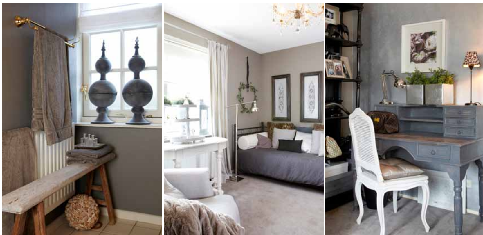
Foto links: in de badkamer heeft H el ne de muren geverfd met Deep Earth van Pure & Original. De wandlampjes en de accessoires zijn gekocht bij Finishing Touch Collection. Foto rechts: op de muur is een zilververf aangebracht van PTMD. Het grijze bureau werd gekocht bij October, het brocantedekstje bij Netty de Groothandel. Foto rechterpagina: het hoofdbord is twaalf jaar geleden door een kunstschilder aangebracht. De vaste, symmetrische kasten zijn door H el ne ontworpen en door een timmerman op maat gemaakt. Het bedtextiel is van PTMD (alles via Finishing Touch Collection).

We verplaatsen ons naar de hal, van waaruit de gastvrouw ons een rondleiding geeft. De dubbele deuren aan de voorzijde van het huis geven de entree iets statigs. “Ik hou van sfeer, dus is de hal ook echt ingericht, maar het hoeft allemaal niet te netjes. De vloertegels zijn daarom oud gemaakt. Het ziet er mooi uit en ik hoef me niet druk te maken om een krasje of deukje.” Vanuit de hal geven dubbele, roedeverdeelde deuren toegang tot een warm ingerichte woonkamer. Een schitterende eiken-